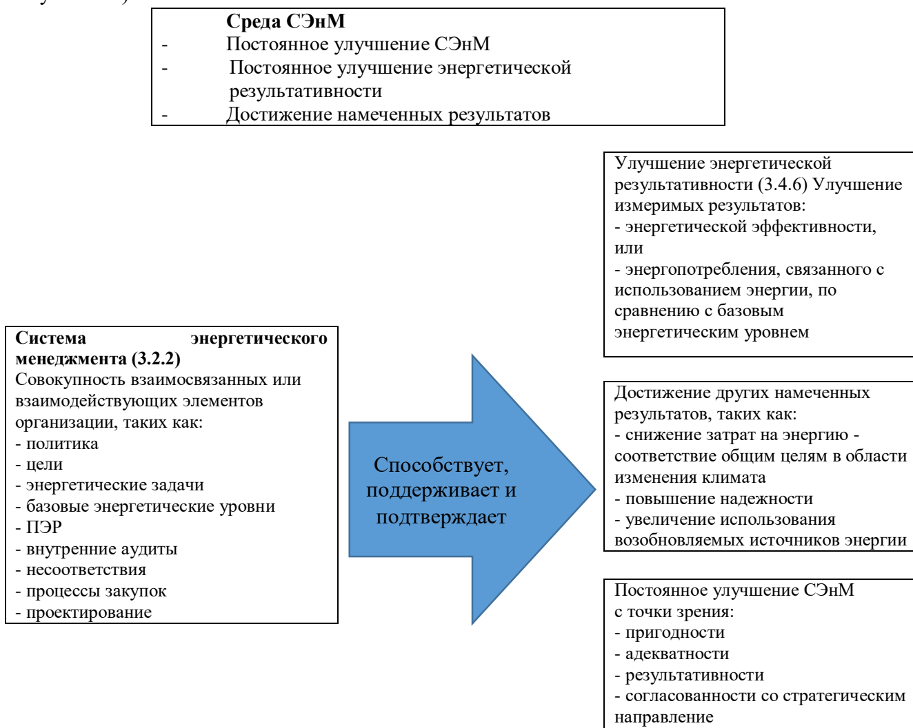
Рисунок А.1 - Взаимосвязь между энергетической результативностью и СЭнМ

Данный документ рассматривает улучшение энергетической результативности и подход системы менеджмента к управлению энергией. СЭнМ использует взаимосвязанные элементы, такие как показатели энергетической результативности (ПЭры) и базовые энергетические уровни (БЭУ) в качестве средства для демонстрации измеримых улучшений в энергоэффективности или энергопотреблении, связанных с использованием энергии (см. Рисунок А.1).