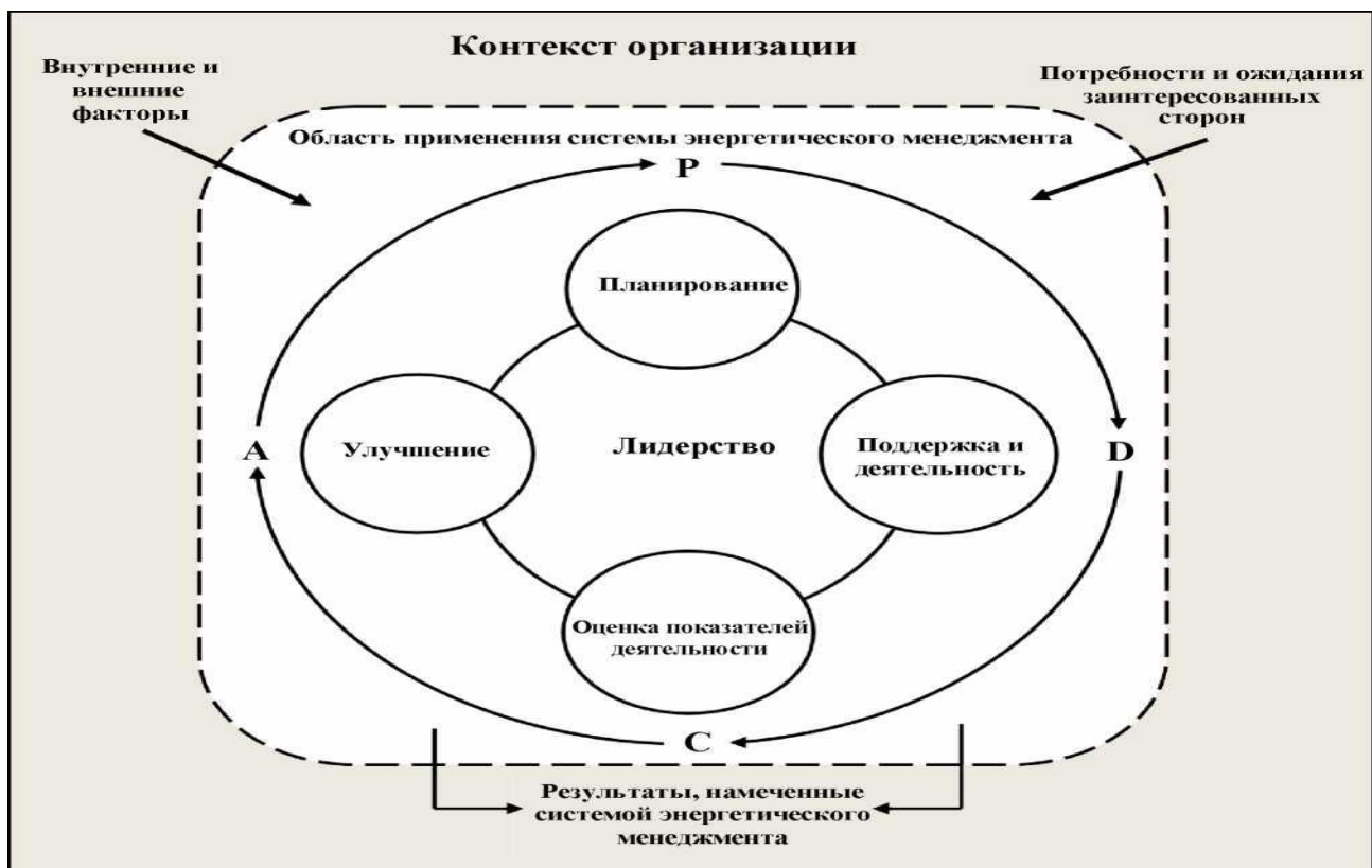
Рис. 1 Цикл PDCA (Plan-Do-Check-Act)